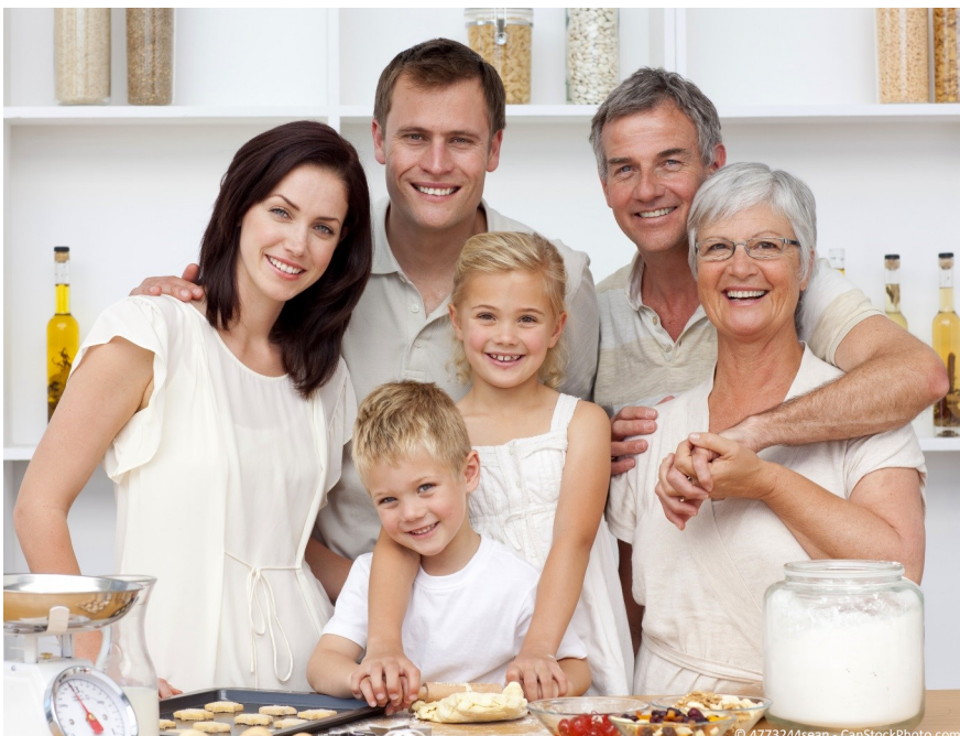
Implantate sind ab 18 Jahren bis in's hohe Alter möglich. Sie geben Sicherheit beim Reden und Lachen und sie ermöglichen es, wie mit eigenen Zähnen zu beißen und zu kauen.

Wenn die Nachbarzähne schon sehr stark gefüllt oder geschädigt sind, kann es besser sein, eine Brücke zu machen. Durch die Kronen werden die Zähne stabilisiert, so dass sie länger halten können.