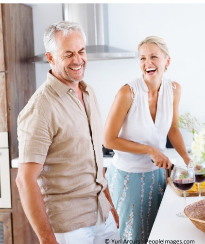
Mit fest sitzenden Zähnen kann man sich wieder jünger fühlen und das Leben aktiver genießen.

Wenn Ihnen schlecht sitzende Prothesen das Leben schwer machen: