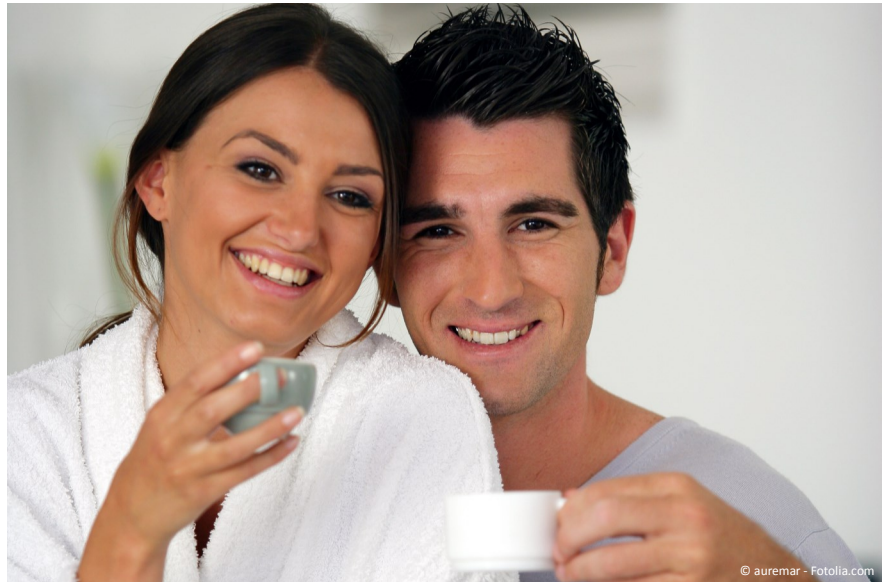
Lückenlos glücklich: Wer heute (z.B. durch einen Unfall) einen Zahn verliert, entscheidet sich meistens für ein Implantat mit Krone. Der Grund ist einfach: Kaum jemand möchte noch, dass gesunde Nachbarzähne für eine Brücke abgeschliffen werden.

Mit einer Zahnlücke kann man auch nicht mehr so gut kauen und abbeißen. Der Kieferknochen baut sich im Bereich der Lücke ab und es entsteht eine Mulde. Einzelne Zähne können beginnen zu