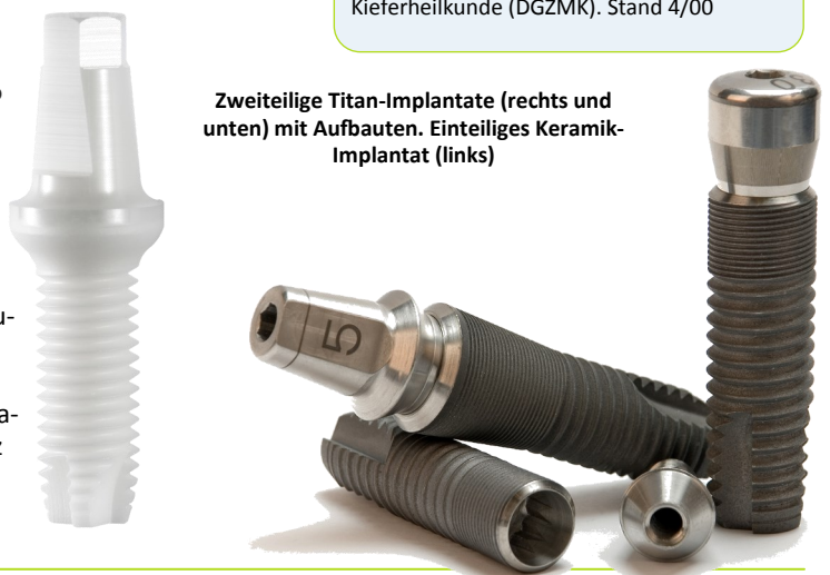
Zweiteilige Titan-Implantate (rechts und unten) mit Aufbauten. Einteiliges Keramik-Implantat (links)

Quelle: Stellungnahme der Deutschen Gesellschaft für Zahn-, Mund- und Kieferheilkunde (DGZMK). Stand 4/00