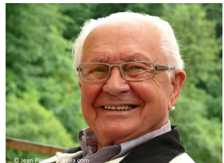
Implantate ersetzen fehlende Zähne fest und komfortabel. Sie haben eine hohe Erfolgsquote und lange Haltbarkeit.

Auch aus diesem Grund entscheiden sich immer mehr Patienten für diese bewährte Art des Zahnersatzes.